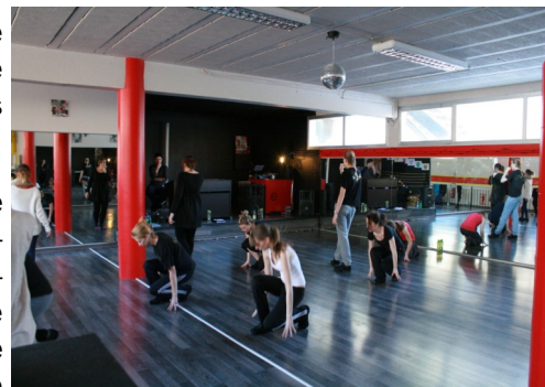
Les répétitions se succèdent

Environ deux heures de spectacle sont envisagées avec au programme une présentation de tableaux reflétant le travail du 1er trimestre autour d'artistes comme Jean-Jacques Goldman, Shy'm, Zazie, etc. On profitera aussi des extraits scéniques du projet clips et on aura une idée de la comédie musicale qui est en train d'être travaillée, peaufinée, accessoirisée dans le plus grand secret. On peut être sûr que chacun donnera son maximum pour que l'école du spectacle « Les Arts de la